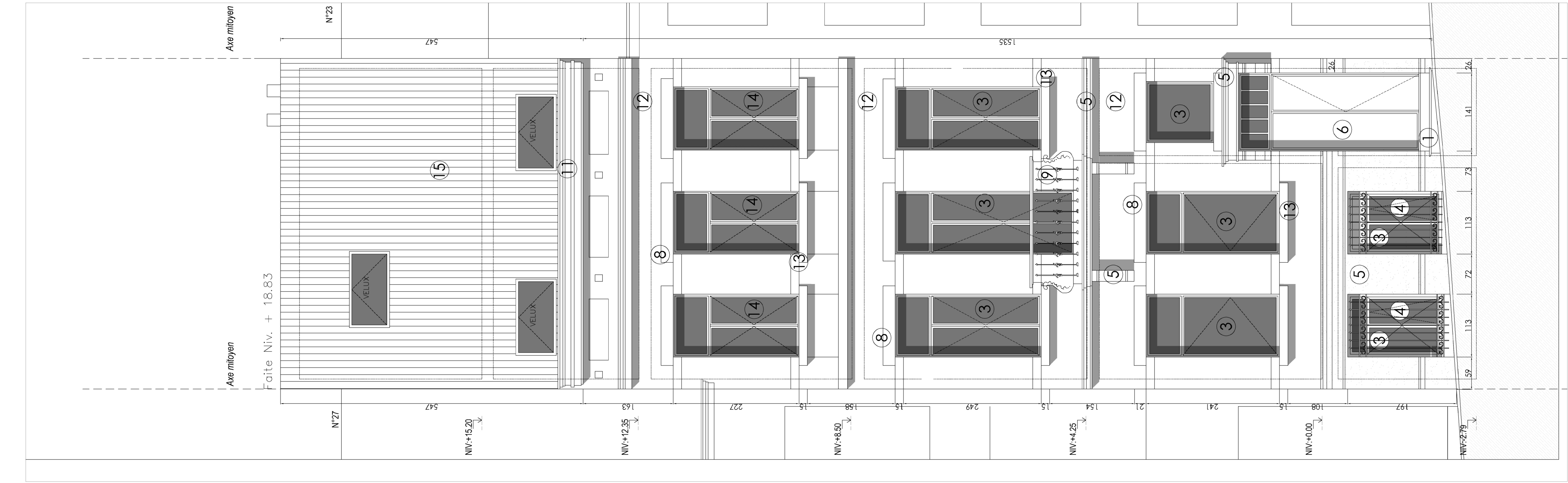
ÉLEVATION FAÇADE RUE ÉCHELLE 1/50e